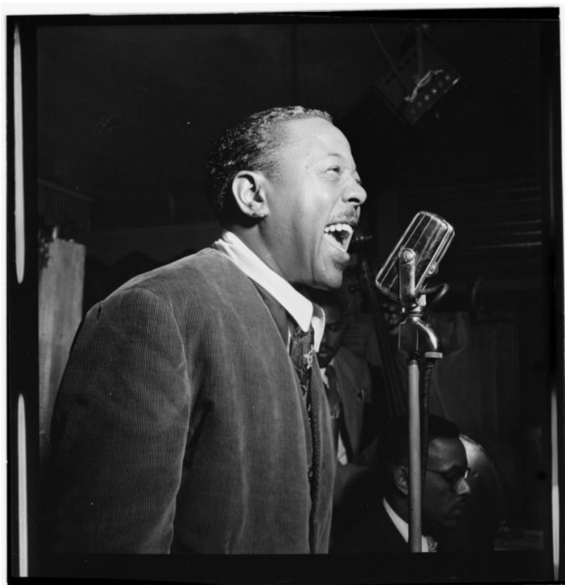
Roy Eldridge, Spotlite (Club), New York, alrededor de noviembre de 1946