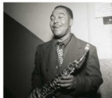
CHARLIE PARKER RÉTROSPECTIVE 1940-1953

Rétrospective 1940-1953 (Saga, 2005. 3CD) retoma el mismo planteamiento que Bird of Paradise . La novedad es un tercer CD en el que se incluyen grabaciones en la radio y en directo, que aportan razones adicionales a la grandeza de este coloso del saxo alto. Un elemento que hace especialmente recomendable este