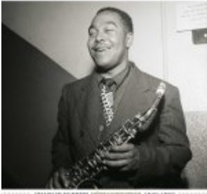
CHARLIE PARKER'S PICTURES 1940-1950