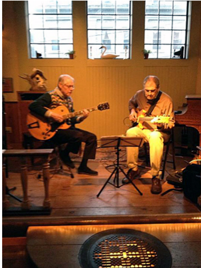
Carriage House, Ithaca, 2013

Enrique Farelo: Is the interest in jazz in the US decreasing lately or is it the same it was before?