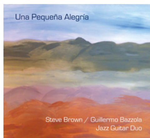
Una Pequeña Alegría Brown Cats Records, 2014