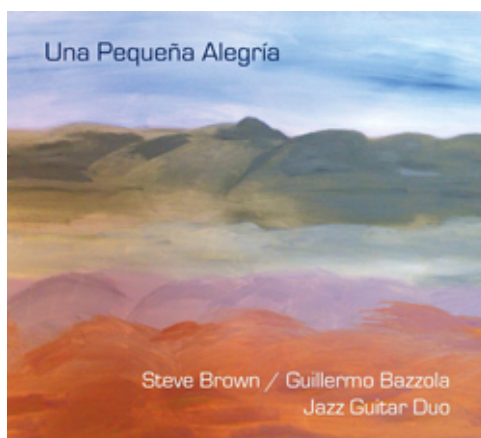
Una Pequeña Alegría