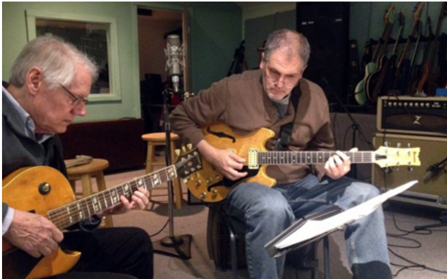
REP Studios, 2013