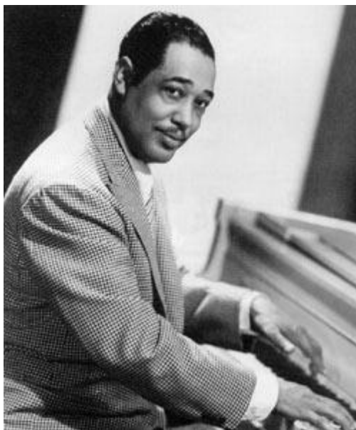
Duke Ellington Alrededor de 1940