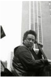
Ilustración: © Alejo Lopomo , 2006

Entrevista por Jean Clouzet y Guy Kopelowicz realizada en 1965 y publicada originalmente en Jazz Magazine. Entrevista traducida al español y publicada en Tomajazz: Charles Mingus. Una tarde incómoda (1965) (Publicado en Tomajazz en mayo de 2003)