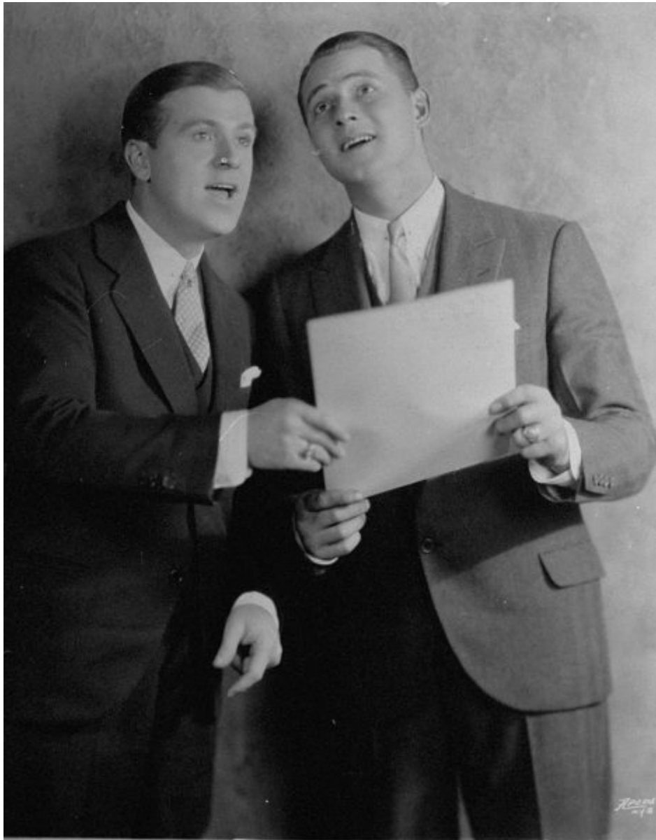
J. Fred Coots y Waite Hoyt, autores de "Santa Claus is Comin' to Town" (1933)