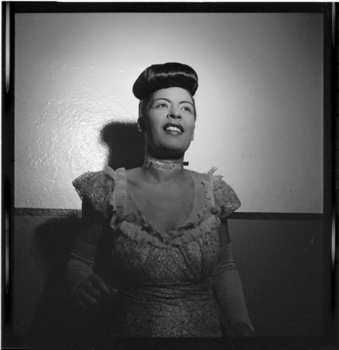
Portrait of Billie Holiday, Carnegie Hall, New York,