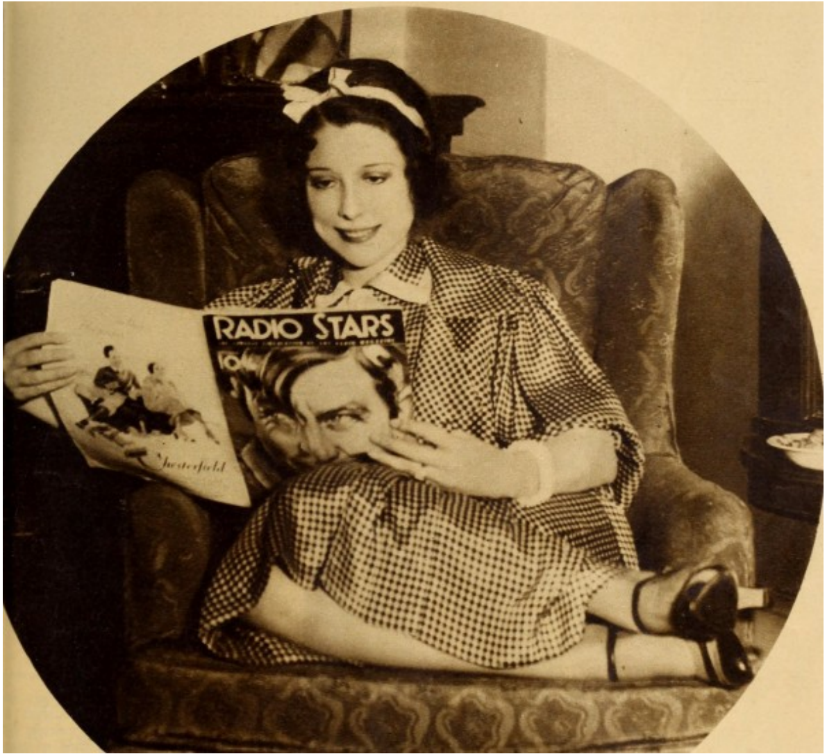
Annette Hanshaw en Radio Stars, enero de 1934