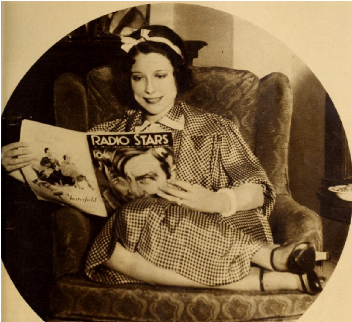
Annette Hanshaw en Radio Stars, enero de 1934