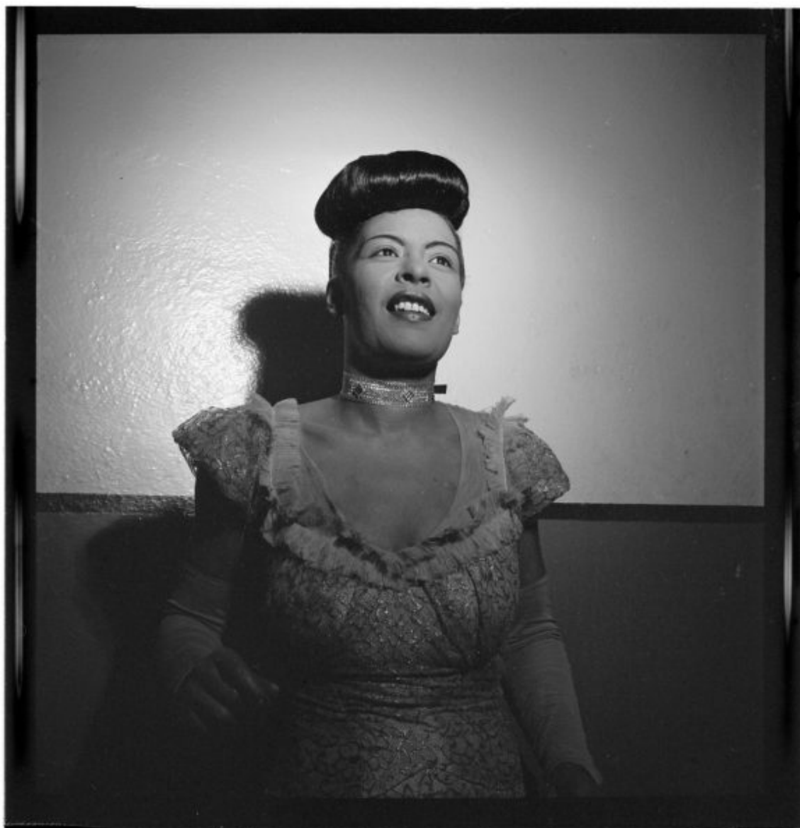
Portrait of Billie Holiday, Carnegie Hall, New York,