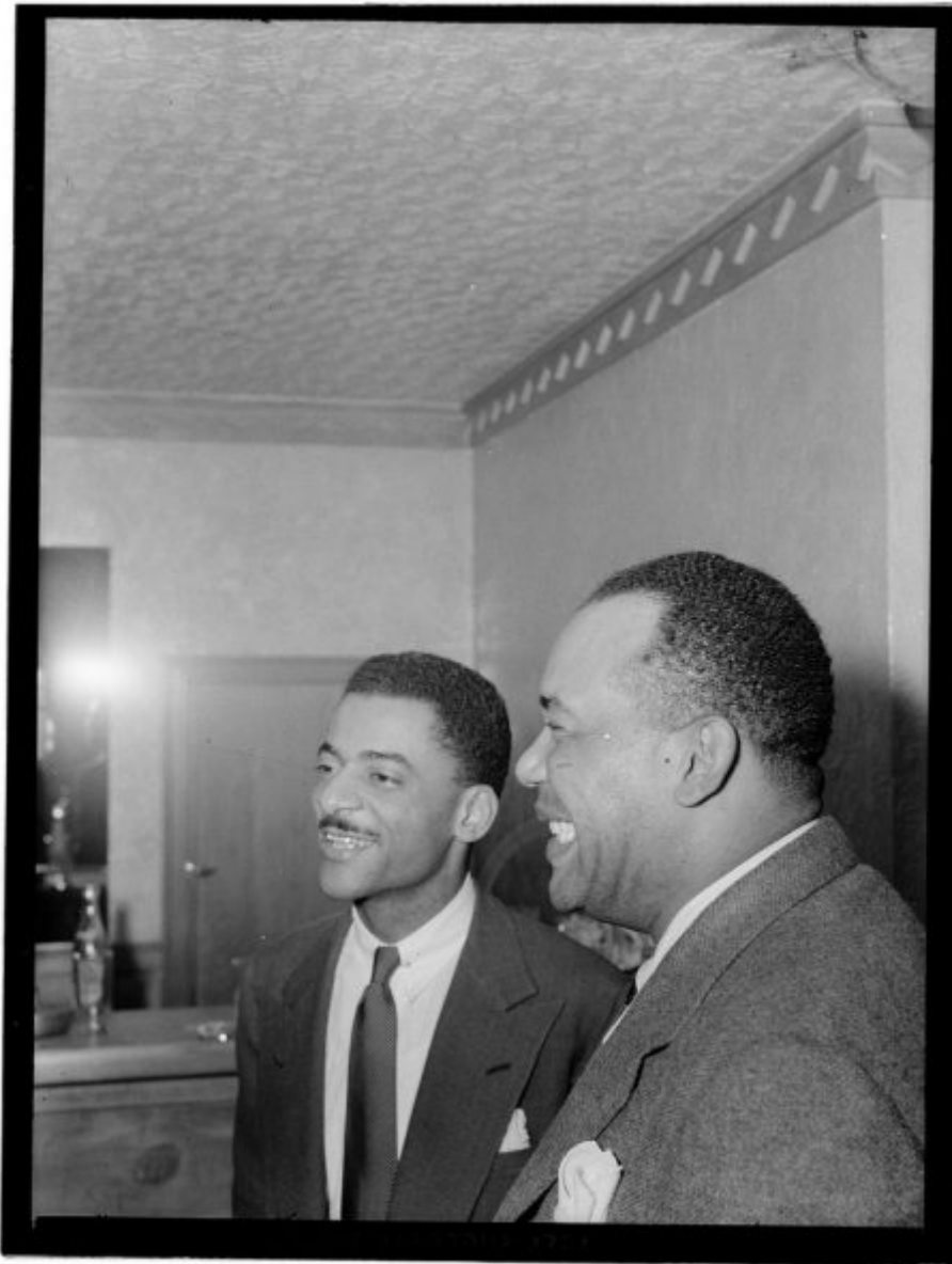
Retrato de Teddy Wilson y Zutty Singleton. Embajada Turca, Washington, D.C. 1940.