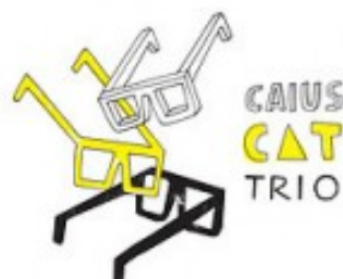
CAIUS CAT TRIO