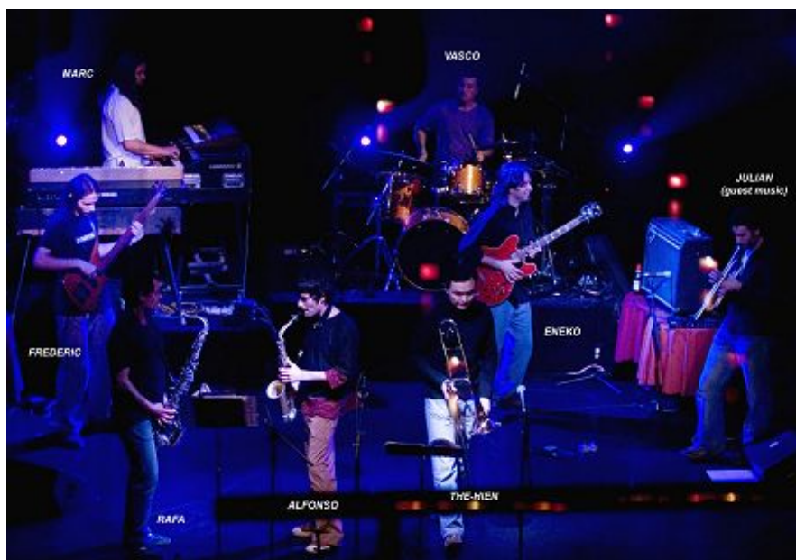
Planeta Imaginario en Luz de Gas, Barcelona, 2007

Desafortunadamente no son muchos los grupos que en España cultivan una carrera musical próxima al ámbito progresivo, ya sea a través del jazz o del rock . Una de las formaciones más destacadas del momento y una decidida apuesta por conservar encendida la antorcha de la música progresiva es Planeta Imaginario . El grupo radicado en Barcelona cuenta con dos discos hasta el momento, el primero de ellos titulado ¿Qué me