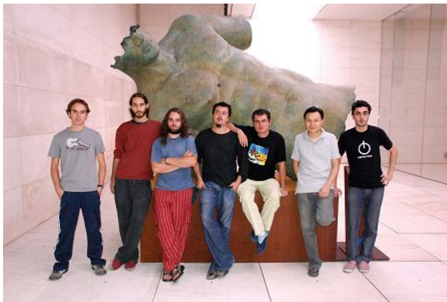
Planeta Imaginario en Caixa Fórum, Barcelona, 2007