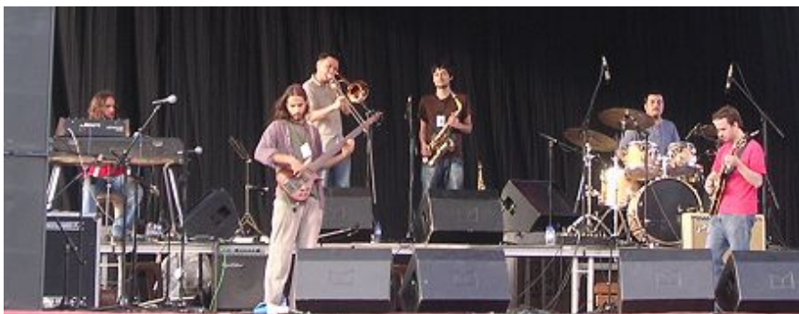
Planeta Imaginario en directo en Vilaseca,