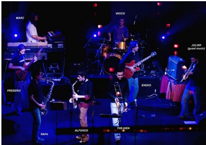
Planeta Imaginario en Luz de Gas, Barcelona, 2007

forma parte del grupo. ¿Quiere esto decir que puede cambiar el sonido del grupo en el futuro?