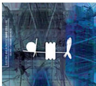
Big Satan – Saved Hear y Hard Cell – Live