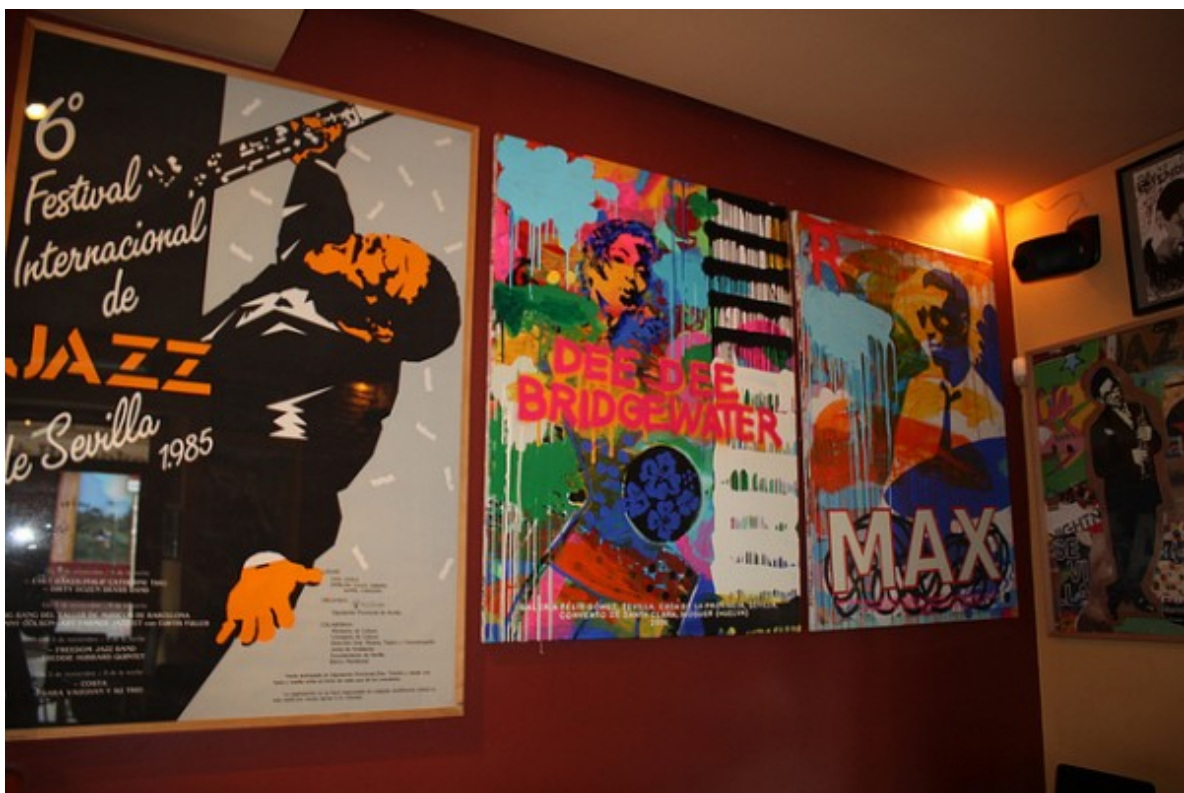
Cuadros del pintor Manolo Cuervo en una de las paredes del Naima Jazz Café

Como decimos, y pueden ver en la foto de más arriba, es un lugar pequeño, con una barra de madera en semicírculo y unas cuantas mesas que se amplían a una pequeña terraza exterior, preceptiva por obligación para los meses de calor y como zona de fumadores. Si la barra es la orilla de todos, algunos encuentran acomodo en esas mesas que parecen pequeñas islas, que a veces cuesta conquistar y otras aguardan serlo pacientemente. El pequeño territorio intermedio es el del tránsito, es donde el tiempo en el Naima parece no cobrar importancia, pero en realidad es desde donde puedes observar todo lo que sucede.