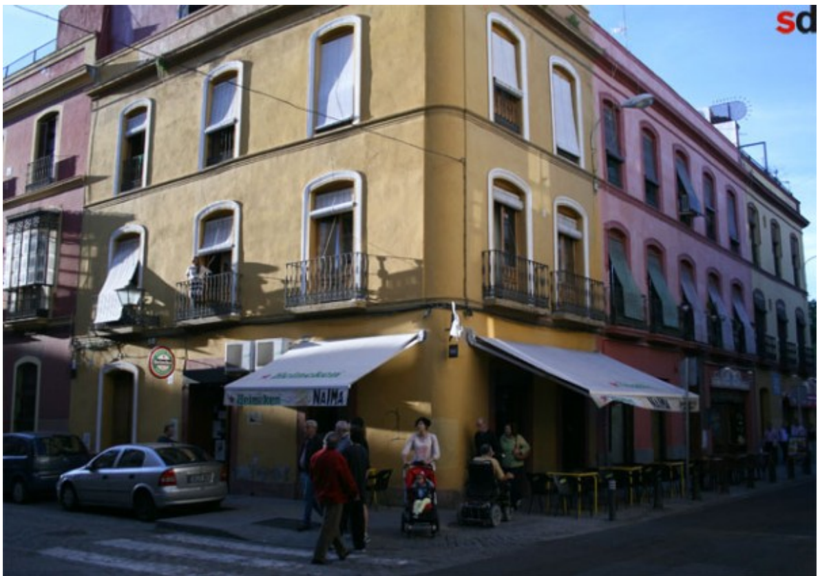
El Naima Café Jazz de Sevilla cumple 18 años