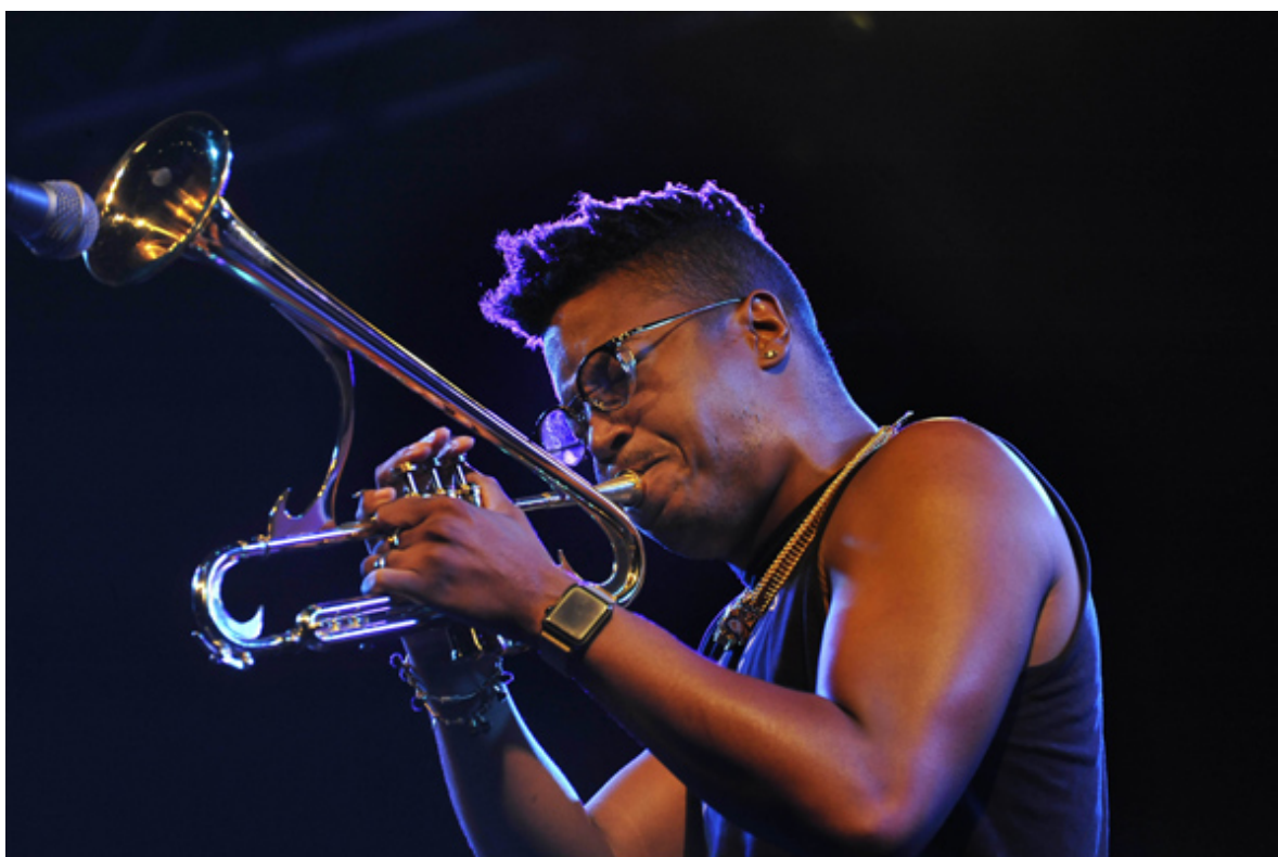
Christian Scott Atunde Adjuah

en los temas de su Stretch Music , fue tan completo y vibrante, tan lleno de matices y tan rico en contenido que no me extrañaría si alguien, aparte de mí, lo considera de lo mejor que ha sonado en esta 29 edición.