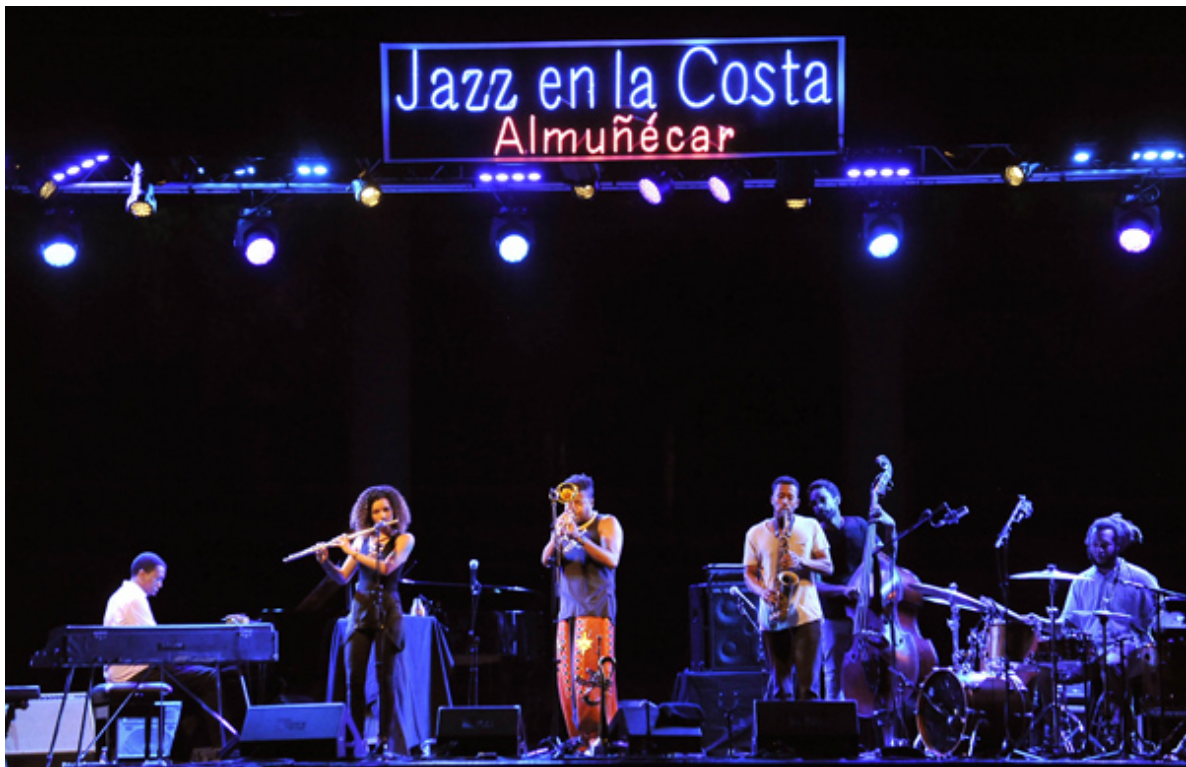
Christian Scott Atunde Adjuah