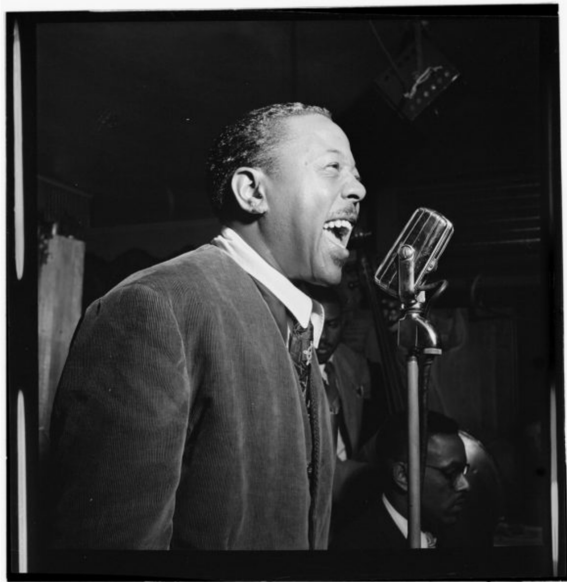
Roy Eldridge, Spotlite (Club), New York, alrededor de noviembre de 1946