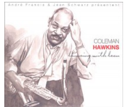
Coleman Hawkins. Bouncing With Bean (Le Chant Du Monde; 2005; 2CD)

La colección de temas de 2015 no recurre a algo tan natural como pudiera ser añadir a lo ya publicado en 2005 un tercer CD con temas que se hayan liberado de los correspondientes derechos en los diez años transcurridos entre una y otra colección. Todo lo contrario. El doble CD de 2005 finalizaba en el año 1949, mientras que el triple CD de 2015 finaliza en el primero de esos CD en ese año, centrando el grueso de la obra en las grabaciones a partir de 1950. También hay que resaltar que si bien hay obras que resultan ineludibles en una recopilación que se precie de Coleman Hawkins como son el histórico tema en solitario "Picasso" de 1948, o su magistral versión de "Body And Soul" de 1938 (un tema que vendió miles y miles de copias, y que es una obra maestra absoluta), no hay muchos más temas que coindican en ambas grabaciones. Por tanto, estamos ante dos obras complementarias que permiten disfrutar de uno de los grandes del saxofón, un músico imprescindible en la historia del jazz y que sirvió de fuente de inspiración a gigantes de la talla de Sonny Rollins y Archie Shepp.