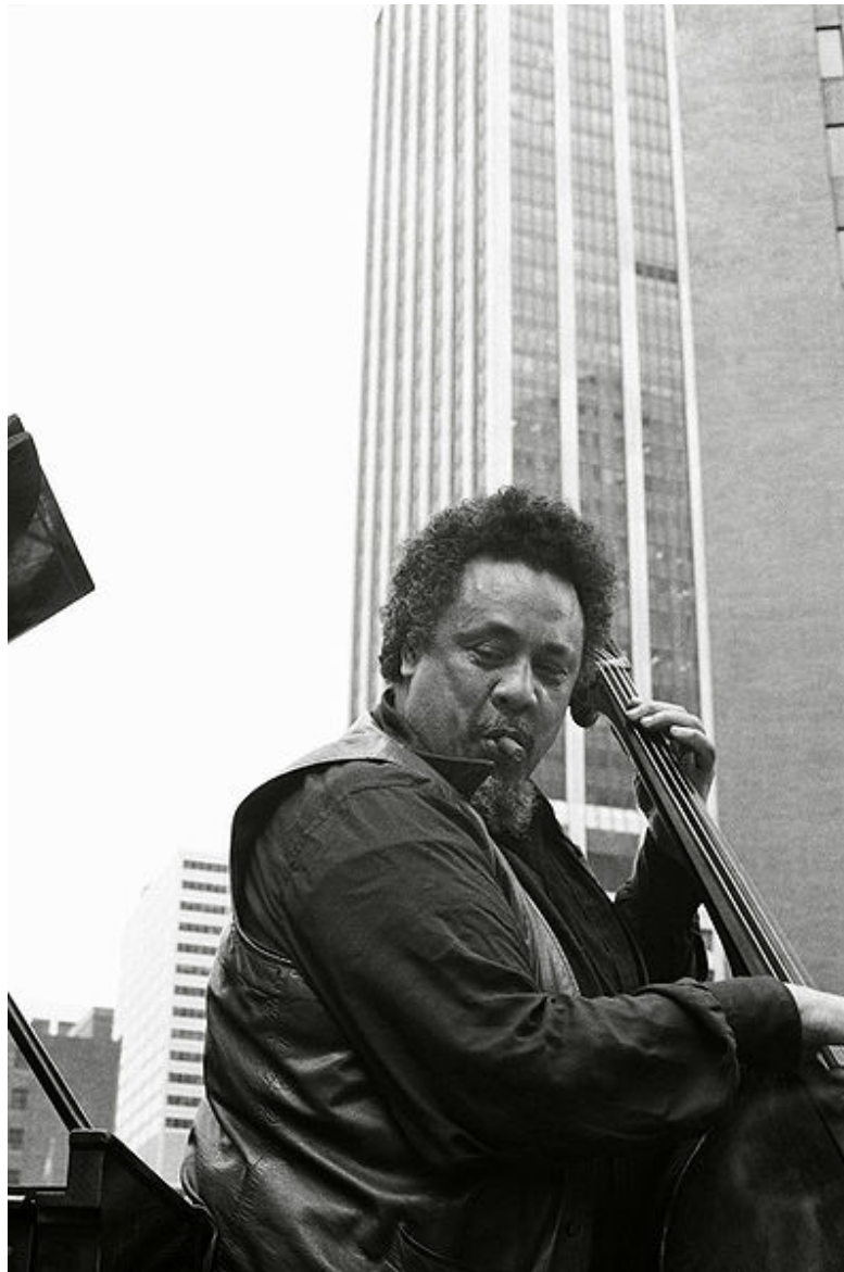
Charles Mingus. Bi Centennial, Lower Manhattan. 1976-07-04.