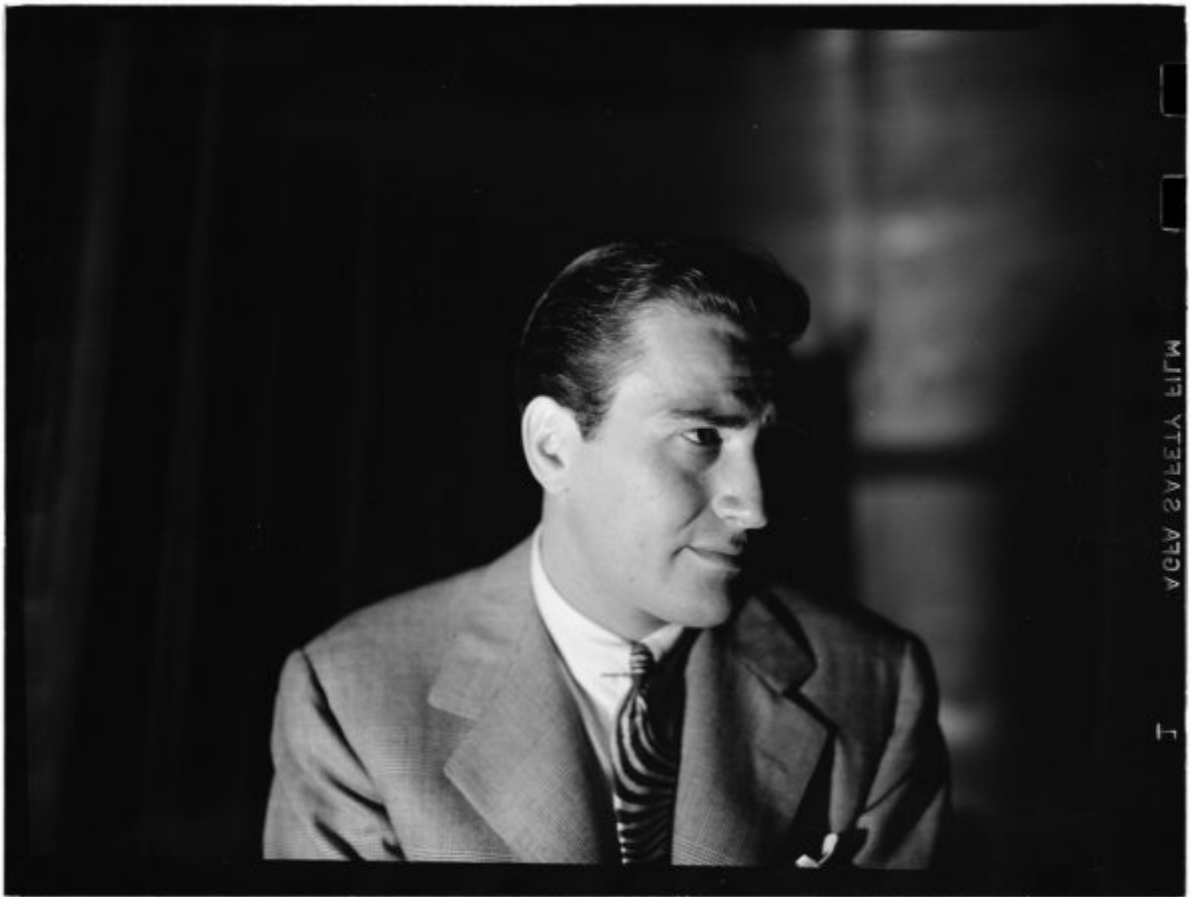
Artie Shaw, alrededor de 1947