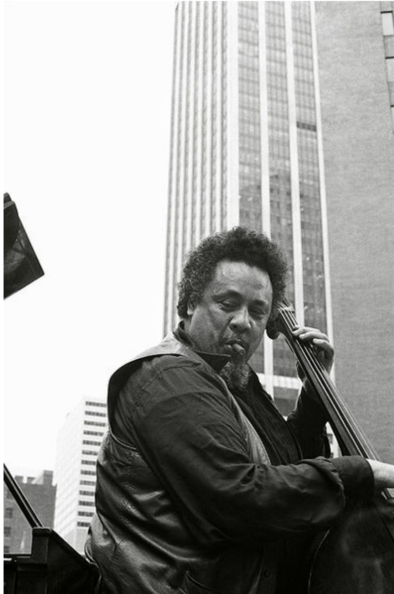
Charles Mingus. Bi Centennial, Lower Manhattan. 1976-07-04.