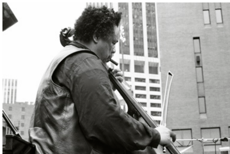
Charles Mingus. Bi Centennial, Lower Manhattan. 1976-07-04.

Jazz Magazine: Tras improvisar con músicos africanos en Argel en 1969, Archie Shepp declaró: “Descubrí mis ancestros”...